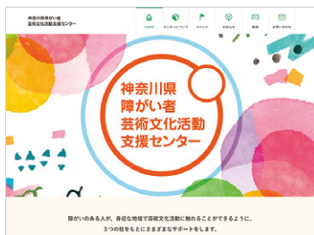
ウェブサイトでの 情報発信