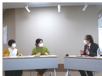
福祉、芸術、教育など多分野の ゲストを招いたオンライン講座