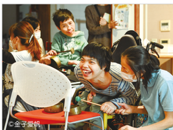
福祉施設での ワークショップの様子