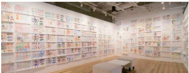
「描くこと | 平田猛 展」2019