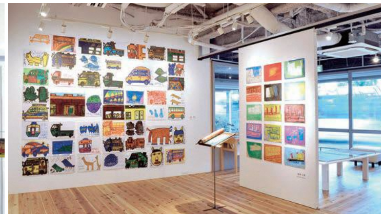
「Co-jin Collection No.3「描くこと」」2017