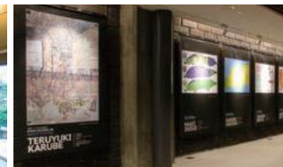
ロームシアター京都