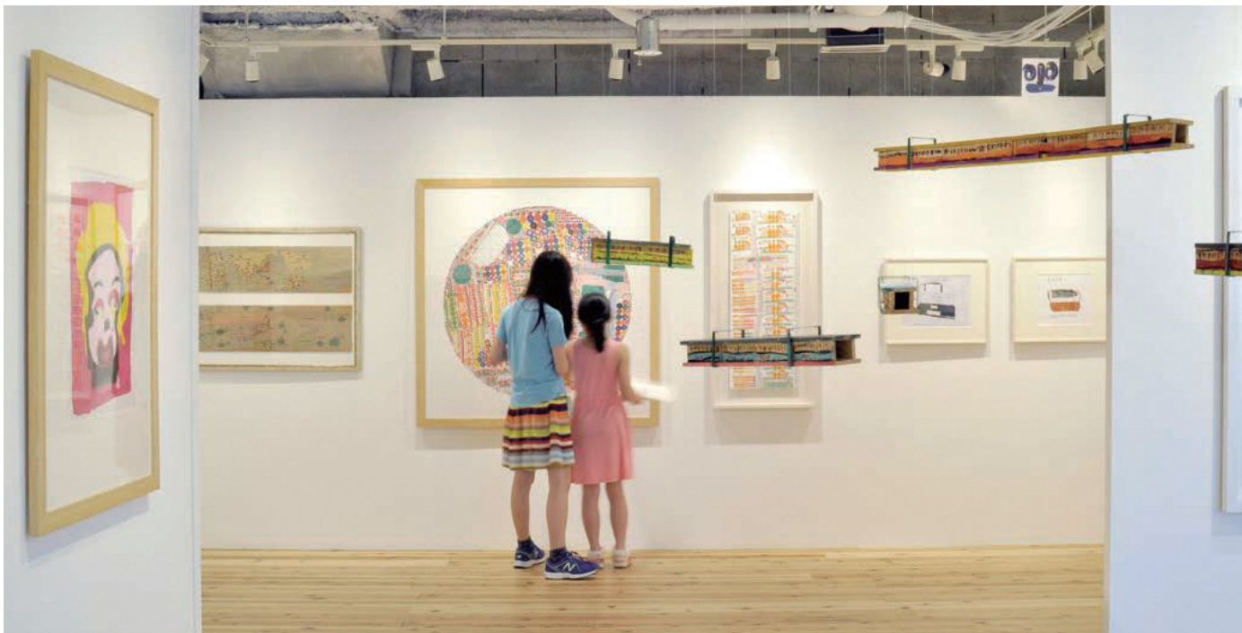
「DO art EXPO ドアバク」2017