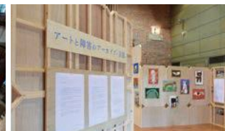
2018年度共生の芸術祭「アートと障害のアーカイブ・京都」展示風景 京都文化博物館(左)舞鶴赤れんがパーク(右)